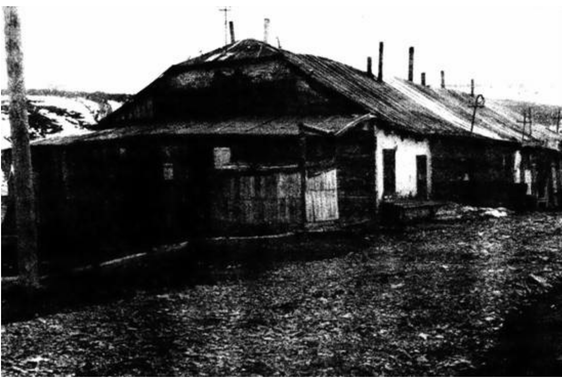
г. Ягодное. Ягоднинский ГОК. Прииск Берзина, поселок Хатыннах. Жилой дом № 18, в котором в 1976 году проживало 8 семей.