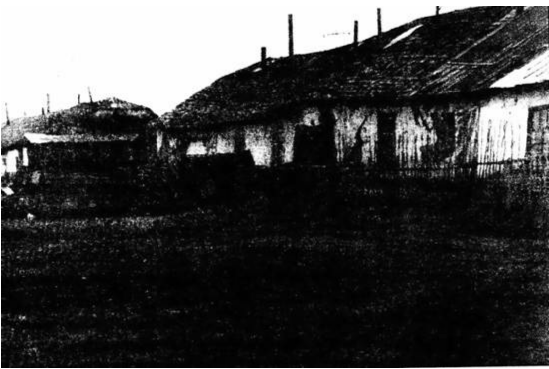
г. Ягодное. Ягоднинский ГОК. Поселок Хатыннах. Два жилых дома, в которых в 1976 году проживало 13 семей.