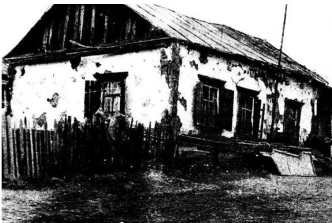
г. Ягодное. Ягоднинский ГОК. Прииск Мальдяк. Жилой дом, построенный в 1942 году, в котором в 1976 году проживало 4 семьи.